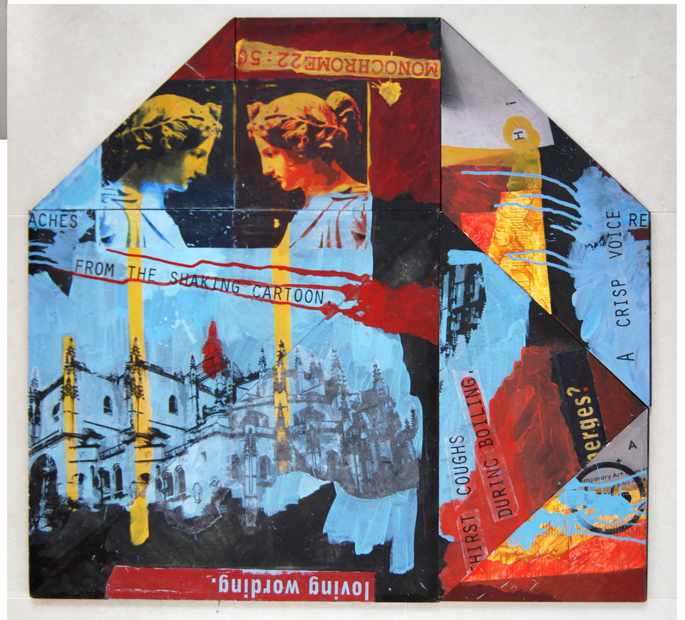
Tangram , 2016, akril in kolaž na vezani plošči, različne dimenzije